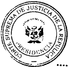
----- Dr. JAVIER VILLA STEIN Presidente del Poder Judicial